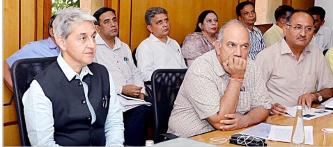
जनस्वास्थ्य अभियांत्रिकी एवं जल संसाधन विभाग की मुख्य सचिव ने समीक्षा बैठक की