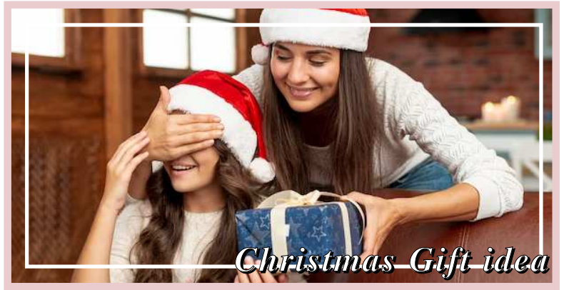
Christmas Gift idea