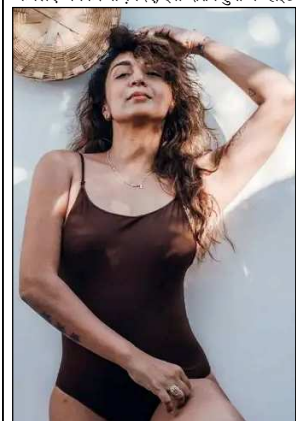
लिफ्टिक के शोड से अपने लुक को कम्प्लेट किया।