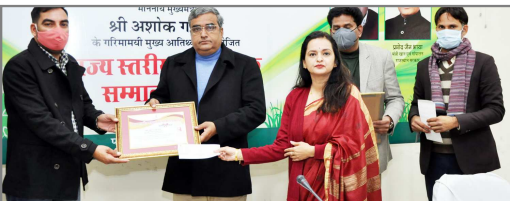
राज्य स्तरीय पशुपालक सम्मान समारोह में 405 पशुपालकों को किया सम्मानित

सबके बावजूद कोई इन पर यकीन करने को तैयार नहीं। महाराष्ट्र और दिल्ली में तेजी से बढ़े केस के बाद सरकार द्वारा लागू की गई सख्ती, दिल्ली में लगे वीकेड लॉक डाउन से जनता में भय व्याप्त है। श्रमिक पलायन कर रहे हैं। सब डरे सहमें हैं। जिससे तेजी से केस बढ़ रहे हैं ऐसे में लगता है कि हो सकता है मतदान के दिन चुनाव ड्यूटी पर तैयार अधिकार कर्मी कोरोना पॉजिटिव होकर क्रांति न हो। मतदाता बूथ से गायब हों। राजनैतिक दल, चुनाव आयोग और सरकार ही बूथ की निहालानी करती नजर आए। आम जनता चाहती है कि पांच राज्यों में होने वाले चुनाव न हों। कोरोना के बढ़ते केस को लेकर अधिकार लोग चिंतित हैं, किंतु राजनैतिक दल नहीं चाहते कि चुनाव हटें। सरकार भी इस पर चुपची साधे हैं। ऐसे में चुनाव आयोग ने चुनाव कराने की घोषणा कर दी। कोरोना महामारी के काल में आयोग को मतदाता प्रदेश में मतदान में लगे कर्मियों की राय लेनी चाहिए थी। क्या वह भी इसके लिए तैयार है। जिन्हें चोट डालने हैं, उनसे पूछ नहीं गया। और तय कर दिया कि चुनाव तो हों ही। कोरोना का हालत यह है कि देश में 24 घंटे में एक लाख 93 हजार नए कोरोना संक्रमित पाए गए। 24 घंटे में 15.8 फीसदी अधिक नए मरीज मिले। तीन दिन में मौत का आंकड़ा 900 के करीब पहुंच गया। एक्टिव केस यानी इलाज करा रहे मरीजों की संख्या में 1 लाख 33 हजार 318 की बढ़ोतरी दर्ज की गई। इस वक 9.48 लाख कोरोना संक्रमितों का इलाज चल रहा है।