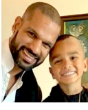
शिखर धवन ने शेयर किया नया लुक