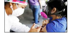
गंभीर बीमारियों से पीड़ित बच्चों को पहले मिल सकता है फायदा

नई दिल्ली (हमारा वतन) कोरोना की तीसरी लहर की आहट के बीच देश में 12-18 साल के बच्चों का वैक्सीनेशन अगले महीने शुरू हो जाएगा। न्यूज एजेंसी रॉयटर्स ने सूत्रों के हवाले से ये रिपोर्ट दी है। इसके मुताबिक कैडिला हेल्थकेयर अगले महीने बच्चों की वैक्सीन जायकोव-डी लॉन्च कर देगी। इसके इमरजेंसी यूज के लिए ड्रग्स कंट्रोलर जनरल ऑफ इंडिया (DGCI) ने पिछले महीने मंजूरी दे दी थी। रॉयटर्स की रिपोर्ट के मुताबिक जायडस कैडिला अक्टूबर से हर महीने 1 करोड़ डोज बनाना शुरू कर देगी।